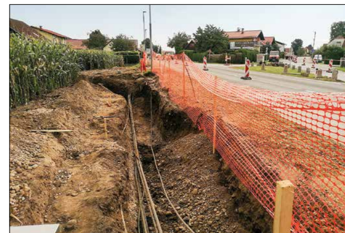
Na Zg. Hajdini pri Maji poteka izgradnja že napovedanega krožišča.