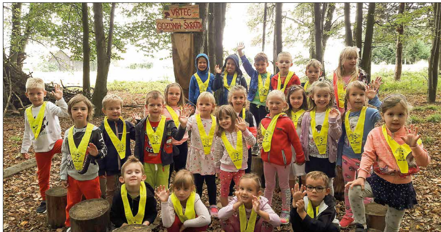
Vrtec gozdnih škratov v naravni igralnici

Otroci potrebujejo gibanje in učenje skozi igro tudi v naravnih okoljih. Te ga se zavedamo tudi v vrtcu, zato otrokom ponujamo veliko bivanja v različnih naravnih okoljih.