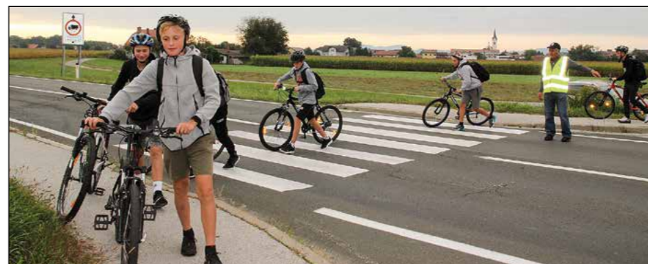
Varno in ob pomoči prostovoljcev v rumenih jopičih čez prehod za pešce