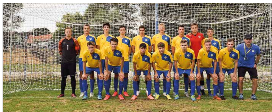
Mladinska ekipa ONŠ Golgeter Hajdina

Z najboljšimi ekipami na vzhodnem delu Slovenije se bodo letos pomerili kadeti in mladinci. Zaradi koronavirusa se nam je namreč uspelo prebiti v višjo ligo brez dodatnih kvalifikacij; liga bo letos štela kar 12 članov. Cilj v takšni konkurenci je zagotovo doseči obstanek v ligi. Morda se to sliši preveč skromno, a žal je realnost takšna.