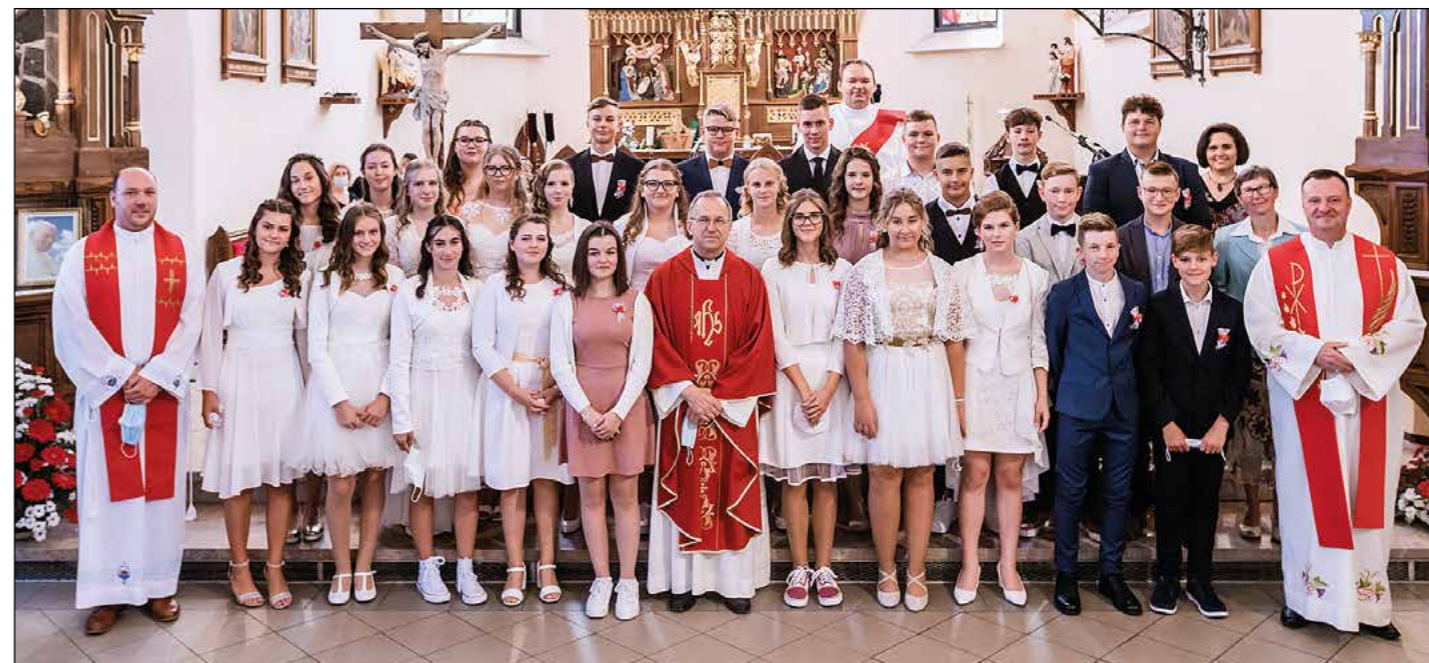
Letošnji birmanci in birmanke v hajdinski župniji