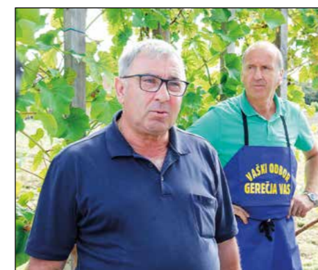
Dobrodošlica pri vaških brajдах v Gerečji vasi