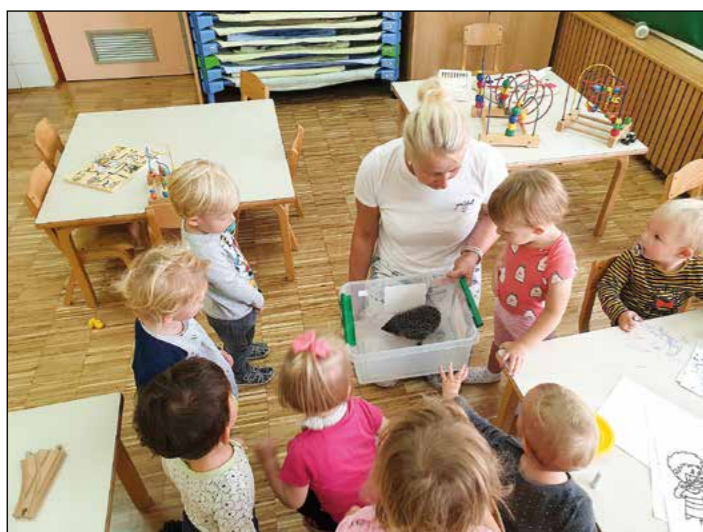
Otroke vijolične igralnice je obiskal pravi ježek.