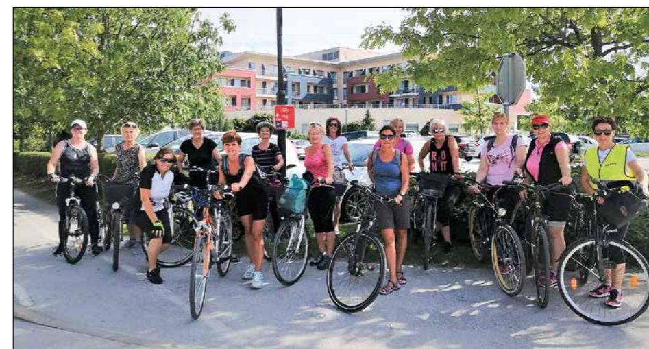
Po Dravski kolesarski poti ...