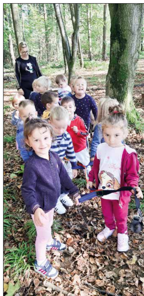
Prvo raziskovanje gozda otrok zelene igralnice v novem vrtčevskem letu