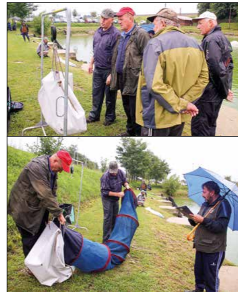
Tehtanje po zaključku tekme