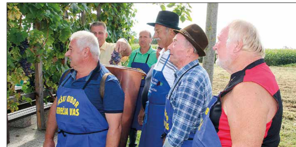
Vsak je lahko odtrgal svoj grozd in ga dal v puto.