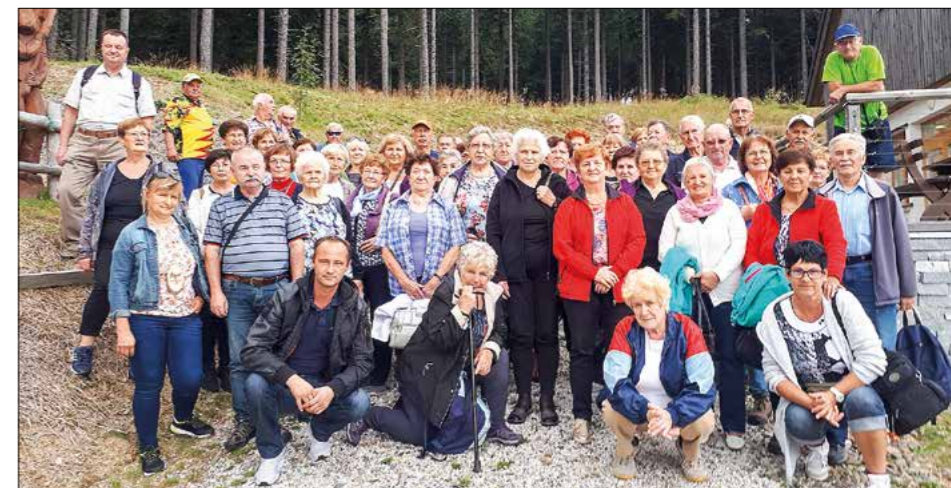
Med izletniki upokojevci je bil tudi kandidat za novega člana, ki pa mu za sprejem manjka še nekaj let. Trikrat lahko ugibate, kdo je to. Odkar ima »pri hiši« kaplana, si lahko kdaj vzame tudi kakšen prost dan.

Ob poslušanju zanimivega predavanja in ogleda filma se je prileglo malo počitka.