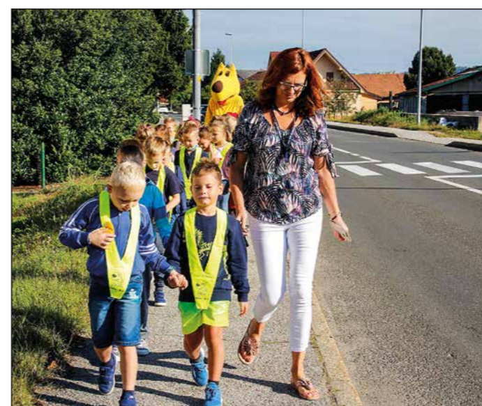
Hajdinski prvošolci so se v družbi maskote Kuža pazi in policista odpravili na kratek sprehod po varni šolski poti v bližini OŠ Hajdina. Nastali so zanimivi utrinki.