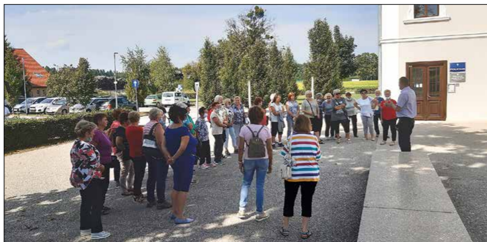
Na obisku v sosednji Občini Kidričevo, na ogledu dvorca Sternthal