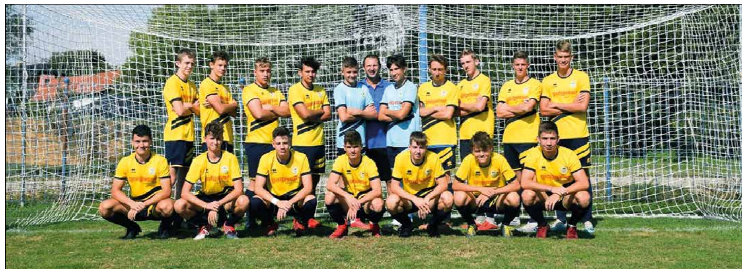
Kadetska ekipa ONŠ Golgeter Hajdina

V začetku avgusta 2020 se je tudi uradno začela že štirinajsta sezona delovanja ONŠ Golgeter Hajdina. V letošnji sezoni bomo v tekmovanju MNZ Ptuj in NZS nastopili z desetimi selekcijami v vseh starostnih kategorijah, od najmlajših cicanbanov U7 vse do mladincev U19. Vključenih bo več kot 150 otrok iz Občine Hajdina in bližnje okolice, kar priča o tem, da je preteklo delo bilo opravljeno več kot odlično.