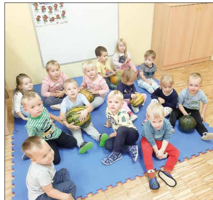
V zeleni igralnici smo se ob zgodbi Razbita buča poigrali tudi z bučami.