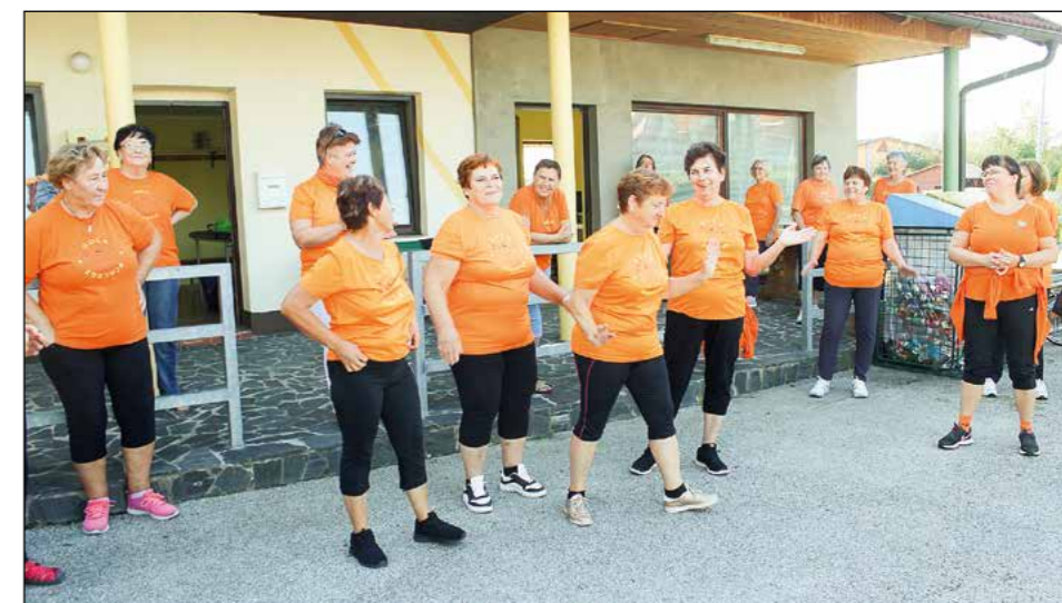
Članice najmlajše skupine Šole zdravja iz Občine Hajdina, domačinke iz Skorbe, so predstavile tudi svojo himno, ki so ji potem sledile še druge skupine.

sodelavci, kineziologi in drugim osebjem, širiti vedenje o pravilni in zdravi telovadbi ter učinkovitem preživljanju prostega časa tudi starejše generacije, ki na ta način dnevno