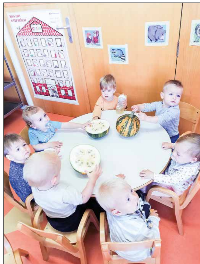
Otroci iz oranžne igralnice in njihov prvi stik s poljsko bučo