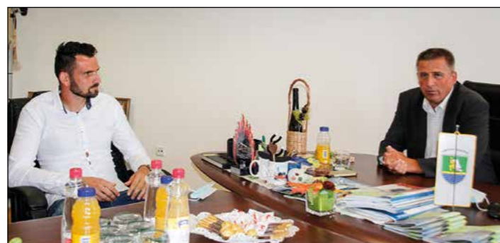
Najboljši vratar slovenske nogometne lige v pretekli sezoni je bil poseben gost pri županu Občine Hajdina.