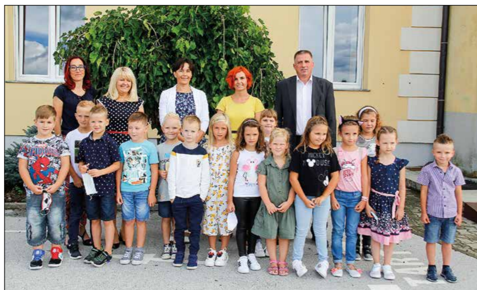
Utrinki na prvi šolski dan na OŠ Hajdina