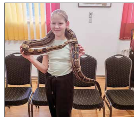
Utrinki z letošnjega druženja mladih slovenjevaških gasilcev

Na pobudo mentorjev v našem društvu smo se odločili, da 6. septembra izpeljemo za gasilsko mladino prireditve z naslovom Mladi gasilci na pomoč . Predstavili smo jim gasilsko tehniko, s katero društvo razpolaga, prav tako smo ponovno v goste povabili društvo ljubiteljev eksotičnih živali Bixoxo, ki so mladim in tudi starejšim obiskovalcem predstavili eksotične živali. Navdušenja ni manjkalo. Mladino in vse prisotne smo tudi skromno pogostili. Tako je nedeljski popoldan minil