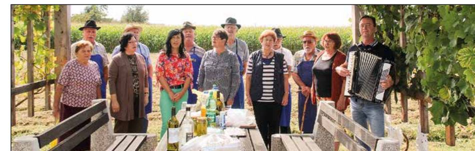
Prijetno jesensko opravilo so s pesmijo obogatili domači pevci in pevke.