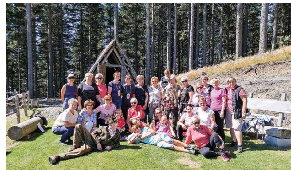
Utrinki s Kop, kjer so se v avgustu potepale članice Društva gospodinje Draženci.