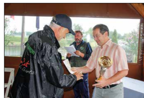
Čestitka najboljšim ribičem