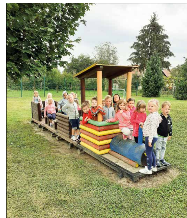
Otroci iz rdeče igralnice se peljemo z vlakom novim dogodivščinam naproti.