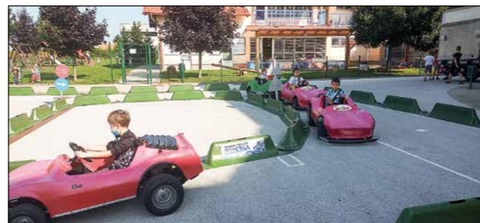
Hajdinski četrtošolci in petošolci so se na poligonu lahko preizkusili tudi kot vozniki malih avtomobilov.

Občina Hajdina že nekaj let na naši šoli omogoči izvajanje programa Jumicar. Letos je bil namenjen učencem četrtega in petega razreda. Izvajal se je v ponedeljek, 14. septembra, pred šolsko zgradbo.