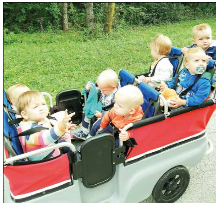
Prvi sprehodi malčkov oranžne igralnice z vozičkom