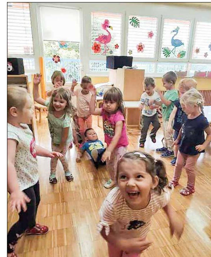
Otroci rumene igralnice so se zabavali ob živahnem plesu.