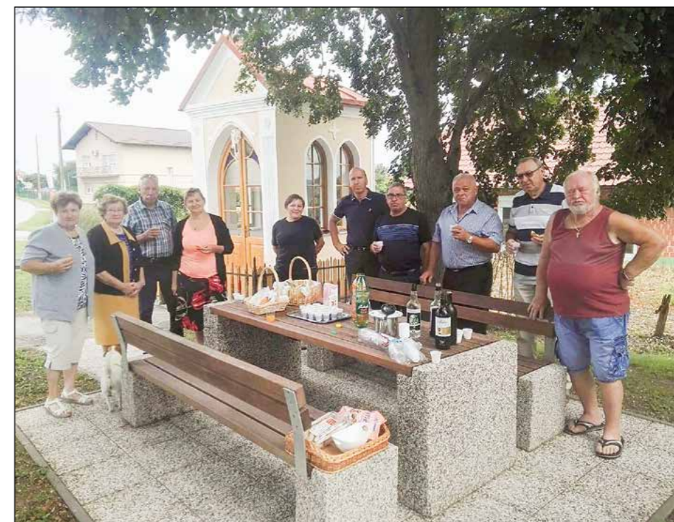
Hajdinski kolesarji so se na poti k praznični maši ustavili pri zvoniku in kapeli v Gerečji vasi.