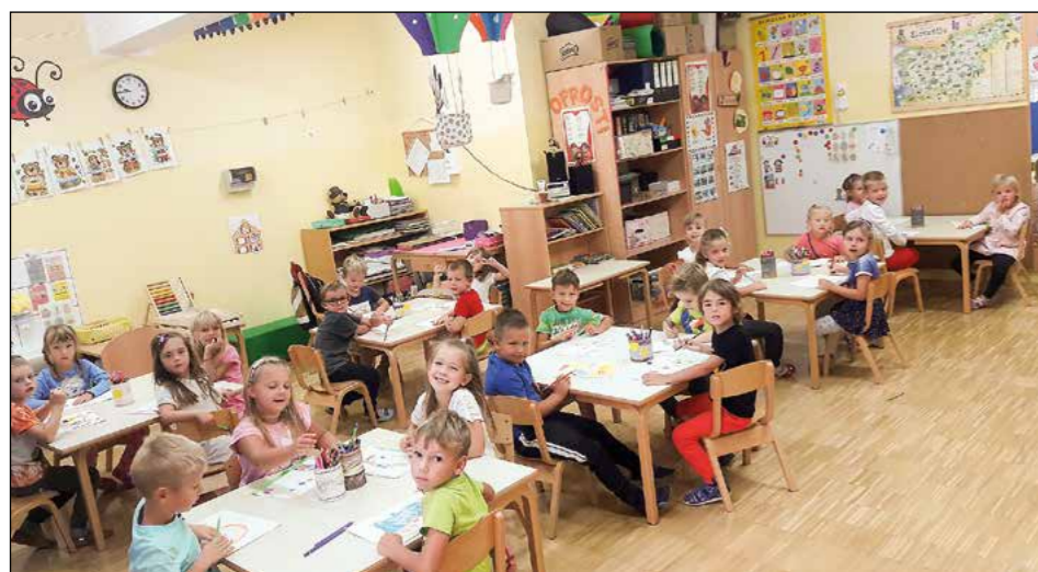
V beli igralnici smo vrtčevsko leto začeli nasmejano, radovedno in ustvarjalno. Skupaj bomo gradili mozaik prijateljstva ter se podali na pot zanimivih dogodivščin in iskanja novega znanja.