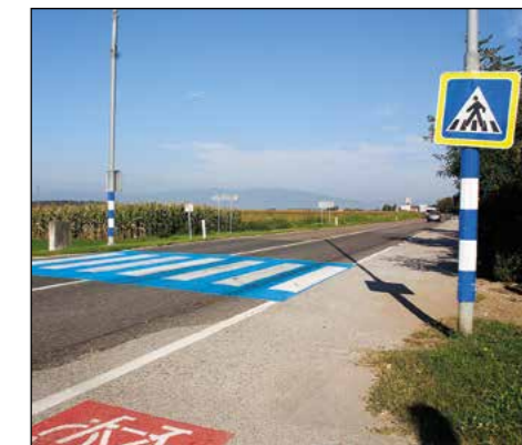
Lokalna skupnost je še pred začetkom novega šolskega leta poskrbela za obnovo talnih označb na prehodih za pešce.