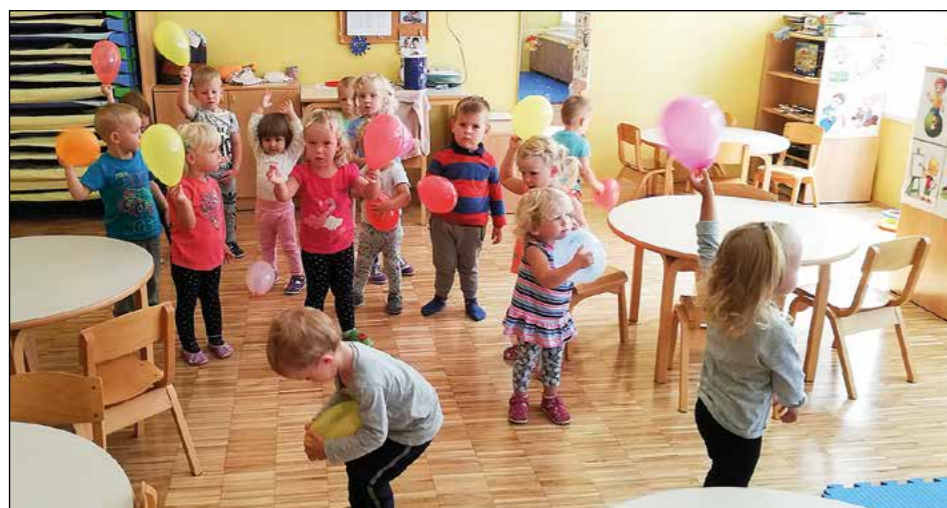
Otroci modre igralnice so izvedli razgibavanje in igro z baloni ter ob tem zelo uživali.