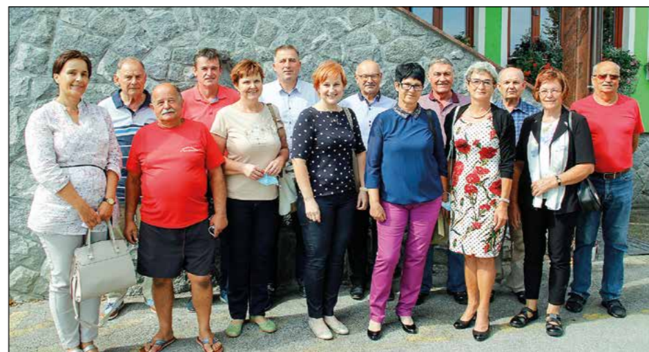
Zbrani na letošnji analizi izvajanja varnosti ob začetku novega šolskega leta v Občini Hajdina

Vodstvo Občine Hajdina je skupaj z OŠ Hajdina in Svetom za preventivo in vzgojo v cestnem prometu ob začetku novega šolskega leta poskrbelo za varnost in dobro počutje najmlajših udeležencev v prometu. Na prehodih za pešce v bližini šole so tudi letos pomagali prostovoljci.