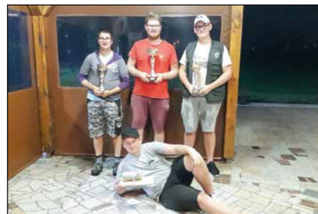
Najboljši na nočni ribiški tekmi v Dražencih