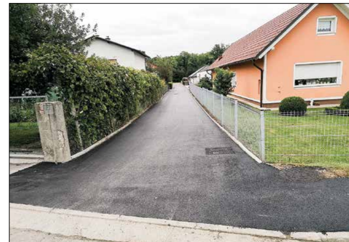
Končana so asfalterska dela na odseku Mlakar–Zg. Hajdina preko proge.

Občina Hajdina je poskrbela za nujna dela ob dravski obkanalski cesti, ob kateri so se drevesa in grmičevje preveč razbohotila. Delavci Cestnega podjetja Ptuj so naredili konkreten poseg v zeleni prostor.