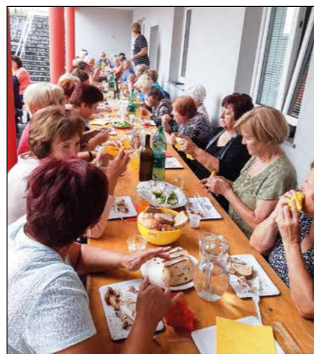
Hajdošanke na tradicionalnem Aninem pikniku