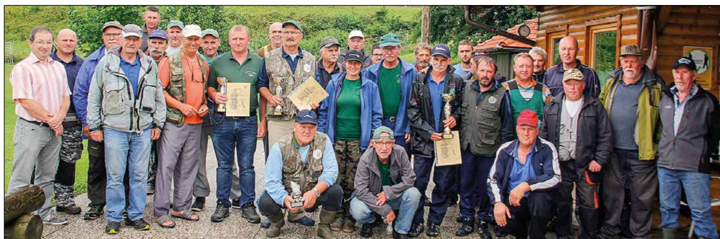
Skupinski posnetek ribiških prijateljev v Draženski jami.